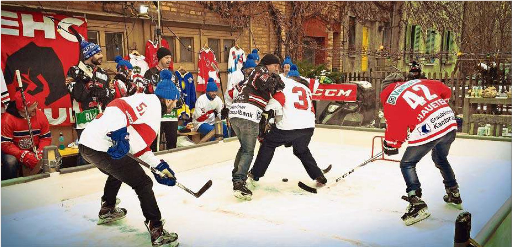
Das gabs noch nie. Ein Eishockeyspiel an der Neptunstrasse. Dass das Feld relativ klein war, machte den Spass nur umso grösser.

Und so hat er mithilfe der Swiss Ice Hockey Federation, seiner Kum-pels Stefan Böhi, Martin Rapold und seiner Frau und Geschäftspartnerin